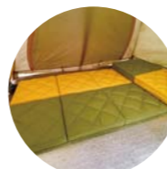
2枚並べてテントに 底付きがありません